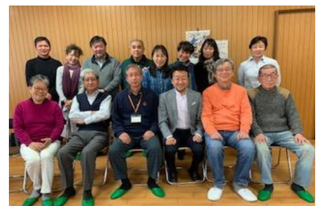
▲▼新年度の役員も頑張ります!